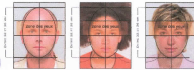
CONFORME À LA NORME ISO/IEC 19794-5 : 2005